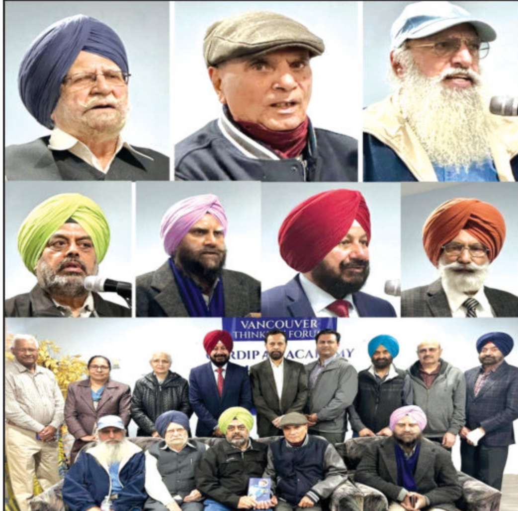
'ਇਸ਼ਕ ਨਾ ਮੰਨੇ ਵਾਟ' ਉਪਰ ਵਿਚਾਰ ਚਰਚਾ ਕਰਨ ਲਈ ਜਰਨੈਲ ਆਰਟ ਗੈਲਰੀ ਅਤੇ ਗੁਰਦੀਪ ਆਰਟਸ ਅਕੈਡਮੀ ਸਰੀ ਦੇ