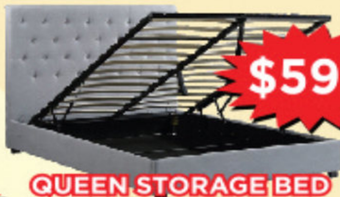
QUEEN STORAGE BED