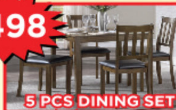
5 PCS DINING SET