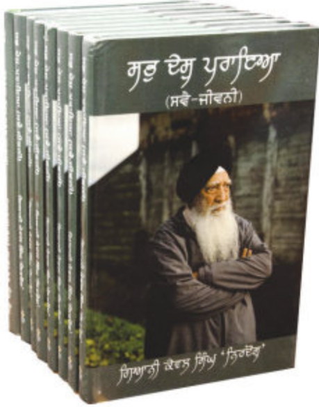
ਲੜੀ ਜੋੜਨ ਲਈ ਪਿਛਲਾ ਅੰਕ ਵੇਖੋ