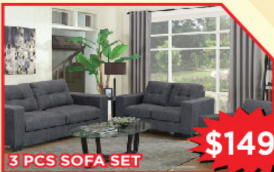
3 PCS SOFA SET