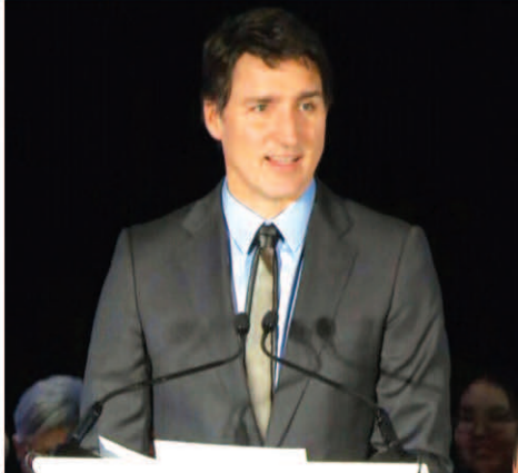
ਐਂਟਲਾਂਟਿਕ ਕੈਨੇਡਾ ਦੇ ਐਮਪੀ ਨੇ ਪਿਛਲੇ ਸਮੇਂ ਵਿਚ ਆਪਣੀ ਹੀ ਸਰਕਾਰ ਦੀ ਕਾਰਜਨ ਕੀਮਤਾਂ ਵਰਗੇ ਮੁੱਦਿਆਂ 'ਤੇ