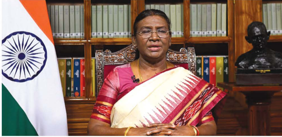
ਅਰਥਚਾਰੇ ਦੀ ਮਜ਼ਬੂਤ ਸਿਹਤ ਤੋਂ ਆਉਂਦਾ ਤੇ ਝਲਕਦਾ ਹੈ। ਉਨ੍ਹਾਂ ਜ਼ੋਰ ਦੇ ਕੇ ਆਖਿਆ ਕਿ ਦੇਸ਼ ਅਮ੍ਰਿਤ ਕਾਲ ਦੇ ਸ਼ੁਰੂਆਤੀ ਸਾਲਾਂ ਵਿੱਚ ਹੈ, ਜੋ ਇਕ ਦੌਰ 'ਚੋਂ ਦੂਜੇ ਵਿੱਚ ਤਬਦੀਲੀ ਦਾ ਸਮਾਂ ਹੈ। ਮੁਰਮੂ ਨੇ ਨਾਗਰਿਕਾਂ ਨੂੰ ਕਿਹਾ ਕਿ ਉਹ ਭਾਰਤ ਨੂੰ ਵਿਕਸਤ ਰਾਸ਼ਟਰ

ਬਣਾਉਣ ਲਈ ਸੰਵਿਧਾਨ ਵਿੱਚ ਮਿਲੇ ਆਪਣੇ ਮੌਲਿਕ ਡਰਜ਼ਾਂ ਦੀ ਪੂਰੀ ਜ਼ਿੰਮੇਵਾਰੀ ਨਾਲ ਪਾਲਣਾ ਕਰਨ। ਰਾਸ਼ਟਰਪਤੀ ਨੇ ਕਿਹਾ ਕਿ ਸਾਨੂੰ ਨੌਜਵਾਨਾਂ ਦੇ ਰਾਹ ਵਿੱਚ ਆਉਂਦੇ ਅਭਿੱਕਿਆਂ ਨੂੰ ਹਟਾਉਣ ਹੋਵੇਗਾ ਤੇ ਉਨ੍ਹਾਂ ਨੂੰ ਆਪਣੀ ਪੂਰੀ ਸਮਰੱਥਾ ਦਿਖਾਉਣ ਦੇ ਮੌਕੇ ਦੇਣੇ ਹੋਣਗੇ। ਉਨ੍ਹਾਂ ਕਿਹਾ, "ਸਰਕਾਰ ਨੇ ਕਰੋਨਾ ਮਹਾਮਾਰੀ ਦੇ ਦਿਨਾਂ ਦੌਰਾਨ ਸਮਾਜ ਦੇ ਕਮਜ਼ੋਰ ਵਰਗਾਂ ਨੂੰ ਮੁਫਤ ਰਾਸ਼ਨ ਮੁਹੱਈਆ ਕਰਵਾਉਣ ਲਈ ਸਕੀਮਾਂ ਦਾ ਘੇਰਾ ਵਧਾਇਆ। ਇਹ ਉਪਰਾਲੇ ਕਮਜ਼ੋਰ ਵਰਗਾਂ ਨੂੰ ਸੰਕਟ ਵਿੱਚੋਂ ਬਾਹਰ ਕੱਢਣ ਲਈ ਮਗਰੋਂ ਵੀ ਜਾਰੀ ਹਨ।"