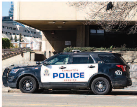
ਬਣਾਇਆ ਗਿਆ ਹੈ। ਉਨ੍ਹਾਂ ਦੱਸਿਆ ਕਿ ਪੁਲਿਸ ਦਾ ਮੰਨਣਾ ਕਿ ਅਪਰਾਧੀ ਹੋਮ ਬਿਲਡਰਾਂ 'ਤੇ ਧਿਆਨ ਕੇਂਦਰਿਤ ਕਰ ਰਹੇ ਹਨ

ਕਿ ਐਡਮਿੰਟਨ ਵਿਚ ਮੁੱਖ ਨਿਸ਼ਾਨਾ ਦੱਖਣੀ ਏਸ਼ੀਅਨ ਮੂਲ ਦੇ ਘਰ ਨਿਰਮਾਤਾ ਹਨ। ਭਾਰਤੀ ਮੂਲ ਦੇ ਲੋਕਾਂ ਨੂੰ ਮੁੱਖ ਰੂਪ ਵਿਚ ਨਿਸ਼ਾਨਾ