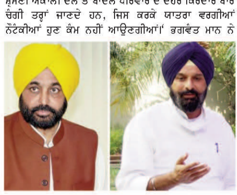
ਕਿਹਾ ਕਿ ਅਕਾਲੀ ਦਲ ਦੇ ਕੁਸ਼ਾਸਨ ਦੌਰਾਨ ਸ਼੍ਰੀ ਗੁਰੂ ਗ੍ਰੰਥ ਸਾਹਿਬ ਜੀ ਦੀ ਬੇਅਦਬੀ, ਗੈਂਗਟਸਰਾਂ ਤੇ ਨਸ਼ਾ ਮਾਰੀਆ ਦੀ ਪ੍ਰਸਤੁਤਪਨਾਹੀ ਵਰਗੇ ਬੱਖਰ ਗੁਨਾਹਾਂ ਵਿੱਚੋਂ ਉਹ ਕਦੇ ਦੁੱਧ ਹੋਣੇ ਸਾਬਤ ਨਹੀਂ ਹੋ ਸਕਦੇ ਹਨ। ਉਨ੍ਹਾਂ ਕਿਹਾ ਕਿ ਲੋਕ ਉਹ ਸਮਾਂ ਕਦੇ ਵੀ ਭੁੱਲ ਨਹੀਂ ਸਕਦੇ, ਜਦੋਂ ਸਮੁੱਚਾ ਪੰਜਾਬ ਕਾਲੇ ਖੇਤੀ ਕਾਨੂੰਨਾਂ ਖ਼ਿਲਾਫ਼ ਖੜ੍ਹਾ ਸੀ ਅਤੇ ਉਸ ਵੇਲੇ ਅਕਾਲੀ ਆਪਣੇ ਸੋਝੇ ਸਿਆਸੀ ਚਿੱਤਾਂ ਲਈ ਨਿਰਲੱਜ ਹੋ ਕੇ ਭਾਜਪਾ ਦੀ ਅਗਵਾਈ ਵਾਲੀ ਕੱਚਰ ਸਰਕਾਰ ਦੇ ਸੋਹਲੇ ਗਾ ਰਹੇ ਸਨ। ਉਨ੍ਹਾਂ ਕਿਹਾ ਕਿ ਅਕਾਲੀ ਦਲ ਦੀ ਪ੍ਰਸਤੁਤਪਤ ਯਾਤਰਾ ਸਿਰਫ਼ ਲੋਕਾਂ ਨੂੰ ਗੁੰਮਰਾਹ ਕਰਨ ਤੇ ਮੀਡੀਆ 'ਚ ਸੁਰਖੀਆਂ ਬਟੋਰਨ ਤੋਂ ਵੱਧ ਹੋਰ ਕੁਝ ਨਹੀਂ ਹੈ। ਉਧਰ ਸ਼੍ਰੋਮਣੀ ਅਕਾਲੀ ਦਲ ਦੇ ਸੀਨੀਅਰ ਆਗੂ ਤੇ ਸਾਬਕਾ ਮੰਤਰੀ ਬਿਕਰਮ ਸਿੰਘ ਮਜੀਠੀਆ ਨੇ ਟਵੀਟ ਕਰਦਿਆਂ ਕਿਹਾ ਕਿ ਸ਼੍ਰੋਮਣੀ ਅਕਾਲੀ ਦਲ ਤਾਂ 'ਪੰਜਾਬ ਬਚਾਓ ਯਾਤਰਾ' ਕੱਢ ਰਿਹਾ ਹੈ ਪਰ ਉਹ ਦਿਨ ਦੂਰ ਨਹੀਂ ਜਦੋਂ ਸਾਰੇ ਪੰਜਾਬੀ 'ਭਗਵੰਤ ਭਯਾਨ ਯਾਤਰਾ ਕੱਢਣਗੇ।' ਉਨ੍ਹਾਂ ਕਿਹਾ, "ਪੰਜਾਬ ਦਾ ਇਤਿਹਾਸ ਕੁਰਬਾਨੀਆਂ ਭਰਿਆ ਹੈ, ਪੰਜਾਬੀ ਇੱਕ ਬਹਾਦਰ ਮਾਰਸ਼ਲ ਕੌਮ ਹੈ। ਭਗਵੰਤ ਮਾਨ ਨੇ ਪੰਜਾਬ 'ਤੇ ਦਿੱਲੀ ਮਾਡਲ ਲਾਗੂ ਕਰ ਦਿੱਤਾ ਤੇ ਸਿਆਸਤ ਵਾਸਤੇ ਪੰਜਾਬ ਨੂੰ ਦਿੱਲੀ ਦੇ ਸਪੁਰਦ ਕਰ ਦਿੱਤਾ ਹੈ।" ਮਜੀਠੀਆ ਨੇ ਕਿਹਾ ਕਿ ਮੁੱਖ ਮੰਤਰੀ ਭਗਵੰਤ ਮਾਨ ਨੇ ਦੇਸ਼ ਨੂੰ ਰਾਹ ਦਿਖਾਉਣ ਵਾਲੇ ਪੰਜਾਬ ਨੂੰ ਦਿੱਲੀ ਕੋਲ ਸੰਭਰ ਕਰ ਦਿੱਤਾ ਹੈ।

ਚੰਡੀਗੜ੍ਹ-ਸ਼੍ਰੋਮਣੀ ਅਕਾਲੀ ਦਲ ਵੱਲੋਂ ਸੂਬੇ ਵਿੱਚ ਕੱਢੀ ਜਾਣ ਵਾਲੀ 'ਪੰਜਾਬ ਬਚਾਓ ਯਾਤਰਾ' ਨੂੰ ਲੈ ਕੇ ਪੰਜਾਬ ਦੇ ਮੁੱਖ ਮੰਤਰੀ ਭਗਵੰਤ ਸਿੰਘ ਮਾਨ ਅਤੇ ਸ਼੍ਰੋਮਣੀ ਅਕਾਲੀ ਦਲ ਦੇ ਸੀਨੀਅਰ ਆਗੂ ਤੇ ਸਾਬਕਾ ਮੰਤਰੀ ਬਿਕਰਮ ਸਿੰਘ ਮਜੀਠੀਆ ਆਹਮੋ-ਸਾਹਮਣੇ ਆ ਗਏ ਹਨ। ਸ਼੍ਰੋਮਣੀ ਅਕਾਲੀ ਦਲ ਨੇ ਪਹਿਲੀ ਫਰਵਰੀ ਤੋਂ ਸੂਬੇ ਦੇ ਸਾਰੇ 117 ਵਿਧਾਨ ਸਭਾ ਹਲਕਿਆਂ ਵਿੱਚ 'ਪੰਜਾਬ ਬਚਾਓ ਯਾਤਰਾ' ਕੱਢਣ ਦਾ ਐਲਾਨ ਕੀਤਾ ਹੈ। ਮੁੱਖ ਮੰਤਰੀ ਭਗਵੰਤ ਮਾਨ ਨੇ ਸ਼੍ਰੋਮਣੀ ਅਕਾਲੀ ਦਲ ਨੂੰ ਨਿਸ਼ਾਨੇ 'ਤੇ ਲੈਂਦਿਆਂ ਕਿਹਾ ਕਿ ਯਾਤਰਾ ਦਾ ਅਸਲ ਨਾਮ 'ਅਕਾਲੀ ਦਲ ਤੋਂ ਪੰਜਾਬ ਬਚਾ ਲਓ ਯਾਤਰਾ' ਹੋਣਾ ਚਾਹੀਦਾ ਹੈ। ਇਸ 'ਤੇ ਸ਼੍ਰੋਮਣੀ ਅਕਾਲੀ ਦਲ ਦੇ ਆਗੂ ਬਿਕਰਮ ਸਿੰਘ ਮਜੀਠੀਆ ਨੇ ਟਵੀਟ ਰਾਹੀਂ ਪ੍ਰਤੀਕਰਮ ਦਿੱਤਾ ਹੈ। ਮੁੱਖ ਮੰਤਰੀ ਨੇ ਕਿਹਾ ਕਿ ਸ਼੍ਰੋਮਣੀ ਅਕਾਲੀ ਦਲ ਨੇ 15 ਸਾਲਾਂ ਦੇ ਕੁਸ਼ਾਸਨ ਦੌਰਾਨ ਪੰਜਾਬ ਨੂੰ ਬੇਰਹਿਮੀ ਨਾਲ ਲੁੱਟਿਆ ਹੈ, ਜਿਸ ਕਰਕੇ ਯਾਤਰਾ ਦਾ ਅਸਲ ਨਾਮ 'ਅਕਾਲੀ ਦਲ ਤੋਂ ਪੰਜਾਬ ਬਚਾ ਲਓ ਯਾਤਰਾ' ਹੋਣਾ ਚਾਹੀਦਾ ਹੈ। ਉਨ੍ਹਾਂ ਕਿਹਾ ਕਿ ਸੂਬੇ ਦੀ ਸਭ ਤੋਂ ਪੁਰਾਣੀ ਸਿਆਸੀ ਪਾਰਟੀ ਹੁਣ ਹਾਸੀਏ 'ਤੇ ਪਹੁੰਚ ਚੁੱਕੀ ਹੈ ਅਤੇ ਤਿੰਨ ਸੀਟਾਂ ਤੱਕ ਸਿਮਟ ਕੇ ਰਹਿ ਗਈ ਹੈ। 'ਪੰਜਾਬ ਦੇ ਲੋਕ