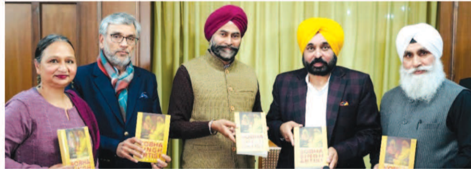
ਇਸ ਕਲਾਕਾਰ ਨੇ ਕਾਂਗੜਾ ਘਾਟੀ ਦੇ ਕਲਾ ਪਿੰਡ ਅੰਦਰੋਟਾ ਵਿਖੇ

1947 ਤੋਂ 1986 ਤੱਕ ਰਚਨਾਤਮਕਤਾ ਦੇ ਚਾਰ ਦਹਾਕੇ