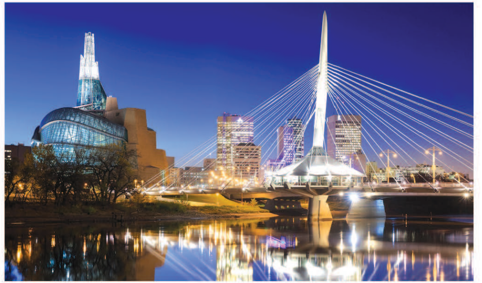
ਆਕਾਰ ਵਾਲੇ ਸ਼ਹਿਰ ਵਿੱਚ ਸਹੂਲਤਾਂ ਅਤੇ ਕਮਿਊਨਿਟੀ ਪ੍ਰੋਗਰਾਮ ਕਰਨਾ ਪੈਂਦਾ ਅਤੇ ਵੱਡੇ ਸ਼ਹਿਰਾਂ ਦੇ ਮੁਕਾਬਲੇ ਨੇਬਰਹੁੱਡਜ਼ ਵੀ ਬਹੁਤੇ ਮਹਿੰਗੇ ਨਹੀਂ।