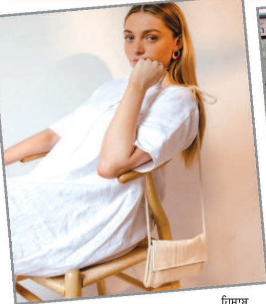
ਹਿਸਾਬ ਨਾਲ ਪਰਸ ਦੀ ਚੋਣ ਕਰੋਗੇ। ਮਨ ਲਓ ਕਿ ਤੁਸੀਂ ਸਫਰ

ਜਿਸ ਤਰ੍ਹਾਂ ਸਫਰ ਵਿਚ ਜਾਂਦੇ ਸਮੇਂ ਕੱਪੜਿਆਂ ਨੂੰ ਬਚਾਅ ਕੇ ਰੱਖਦੇ ਹੋ, ਠੀਕ ਉਸੇ ਤਰ੍ਹਾਂ ਹੈਂਡਬੈਗ ਨੂੰ ਵੀ ਸੰਭਾਲਣਾ ਬਹੁਤ ਜ਼ਰੂਰੀ ਹੈ। ਇਹ ਤਾਂ ਹੀ ਸੰਭਵ ਹੋਵੇਗਾ ਜਦੋਂ ਤੁਸੀਂ ਜਗ੍ਹਾ ਦੇ