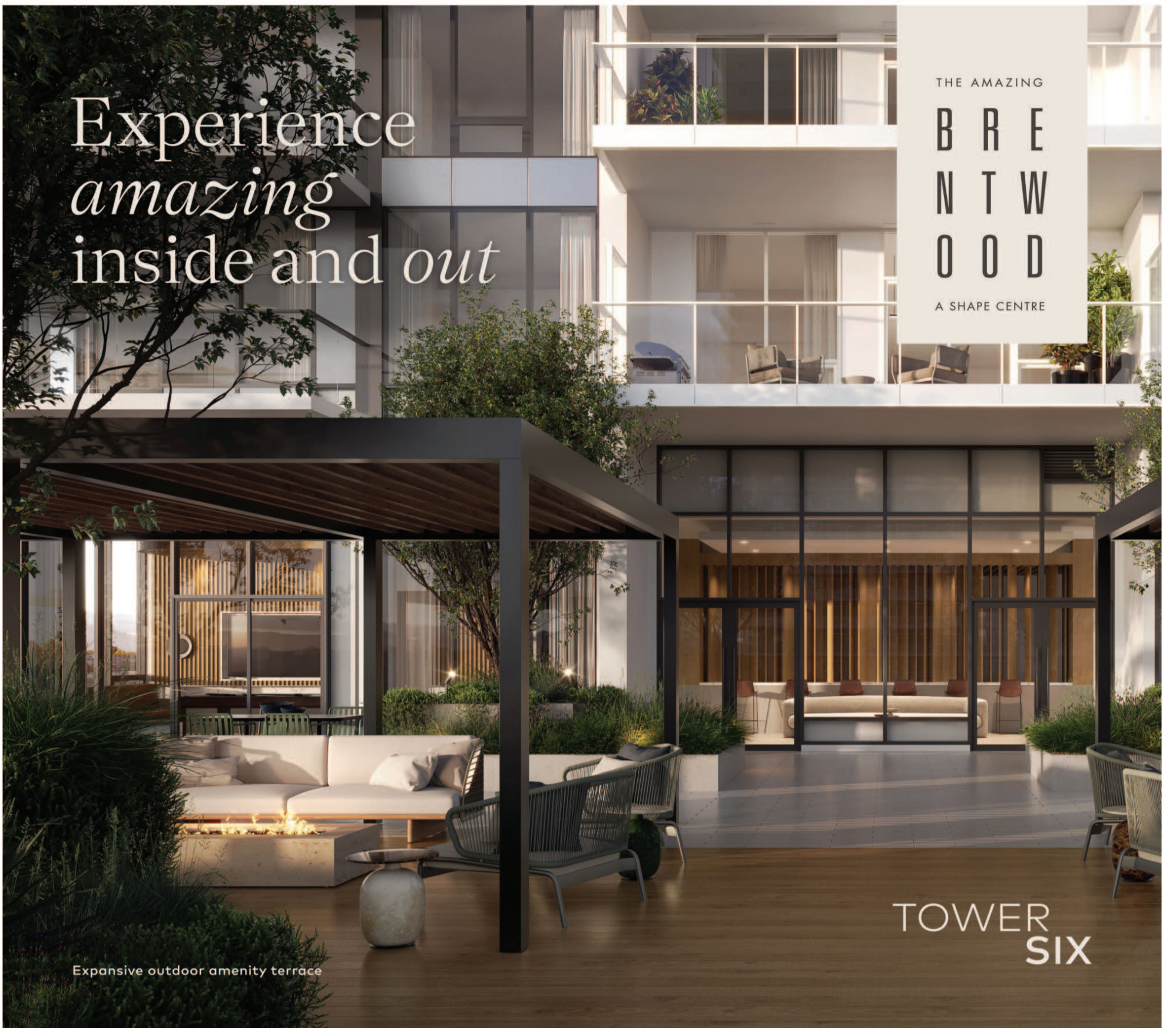
Expansive outdoor amenity terrace