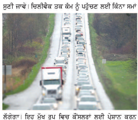
ਲੱਗੇਗਾ। ਇਹ ਮੁੱਖ ਰੂਪ ਵਿਚ ਕੌਸਲਰਾਂ ਲਈ ਪ੍ਰੇਸ਼ਾਨ ਕਰਨ