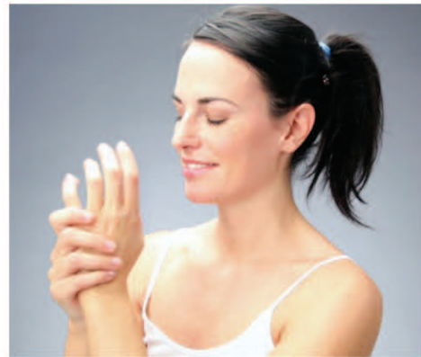
ਕਰਨ ਤੋਂ ਬਾਅਦ ਸੌ ਜਾਓ। ਚਾਰ ਚਮਚ ਬਦਾਮ ਤੇਲ, ਇਕ ਚਮਚ ਗੁਲਾਬ ਜਲ ਅਤੇ ਅੱਧਾ ਚਮਚ ਟਿਚਰ ਬੈਂਜ਼ੋਈਨ ਨੂੰ ਮਿਲਾ ਕੇ ਬਣੇ

ਤਾਂ ਹੱਥਾਂ-ਪੈਰਾਂ 'ਤੇ ਮਲ ਕੇ ਹੌਲੀ-ਹੌਲੀ ਮਾਲਸ਼ ਕਰੋ। ਇਸ ਨਾਲ ਚਮੜੀ ਮੁਲਾਇਮ ਹੋਵੇਗੀ ਅਤੇ ਚਮੜੀ 'ਤੇ ਜੰਮੀ ਮੈਲ, ਰੰਦਗੀ ਦੂਰ ਹੋਵੇਗੀ। ਤੁਸੀਂ ਇਸ ਪ੍ਰਕਿਰਿਆ ਨੂੰ ਰੋਜ਼ਾਨਾ ਦੁਹਰਾ ਸਕਦੇ ਹੋ ਜਾਂ 1-2 ਦਿਨ ਦੇ ਵਕਫ਼ੇ ਬਾਅਦ ਕਰ ਸਕਦੇ ਹੋ। ਇਸਨਾਲ ਤੋਂ ਪਹਿਲਾਂ ਹੱਥਾਂ 'ਤੇ ਕੋਸ਼ਾ ਤੇਲ ਲਗਾ ਕੇ ਹੱਥਾਂ ਦੀ ਚੰਗੀ ਤਰ੍ਹਾਂ ਮਾਲਸ਼ ਕਰੋ ਜਿਸ ਨਾਲ ਹੱਥਾਂ ਦੀ ਚਮੜੀ ਮੁਲਾਇਮ ਹੋ ਜਾਵੇ। ਇਸ ਲਈ ਤੁਸੀਂ ਨਾਰੀਅਲ ਤੇਲ ਜਾਂ ਬਦਾਮ ਤੇਲ ਦੀ ਵਰਤੋਂ ਕਰੋ ਤਾਂ ਜ਼ਿਆਦਾ ਚੰਗਾ ਰਹੇਗਾ। ਨਹਾਉਣ ਤੋਂ ਬਾਅਦ ਜਦੋਂ ਤੁਹਾਡੀ ਚਮੜੀ ਗਿੱਲੀ ਹੋਵੇ ਤਾਂ ਹੱਥਾਂ 'ਤੇ ਮਾਈਸਚਾਈਜ਼ਰ ਲਗਾ ਲਓ ਜਿਸ ਨਾਲ ਚਮੜੀ ਵਿਚ ਨਮੀ ਨੂੰ ਬਣਾਈ ਰੱਖਣ ਵਿਚ ਮਦਦ ਮਿਲੇਗੀ। ਬਦਾਮ, ਦਰੀ ਅਤੇ ਚੁਟਕੀ ਮਾਤਰ ਹਲਦੀ ਪਾ ਕੇ ਬਣੇ ਮਿਸ਼ਰਨ ਨੂੰ ਹੱਥਾਂ 'ਤੇ ਲਗਾ ਕੇ 30 ਮਿਟ ਬਾਅਦ ਹੱਥਾਂ ਨੂੰ ਤਾਜ਼ੇ ਠੰਢੇ ਪਾਣੀ ਨਾਲ ਧੋ ਲਓ। ਇਸ ਪ੍ਰਕਿਰਿਆ ਨੂੰ ਤੁਸੀਂ ਹਫ਼ਤੇ ਵਿਚ ਦੋ ਵਾਰ ਕਰ ਸਕਦੇ ਹੋ। ਰਾਤ ਨੂੰ ਸੌਣ ਤੋਂ ਪਹਿਲਾਂ ਹੱਥਾਂ 'ਤੇ ਪੌਸ਼ਕ ਕ੍ਰੀਮ ਦੀ ਹਲਕੀ ਹਲਕੀ ਮਾਲਸ਼