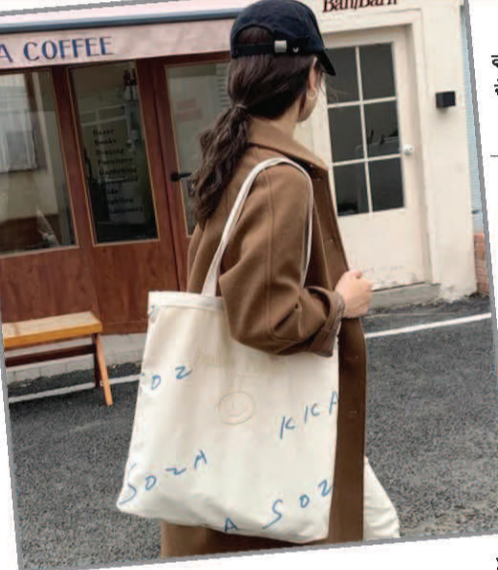
ਔਰਤਾਂ ਨੂੰ ਸਾਧਾਰਨ ਸੋਧ ਡਿਜ਼ਾਈਨ ਦੇ ਹੈਂਡਬੈਗ ਅਤੇ ਪਰਸ ਜ਼ਿਆਦਾ ਫਥਣਗੇ।