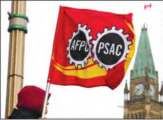
ਚੱਲ ਰਹੀ ਖਜ਼ਾਨਾ ਬੋਰਡ ਦੇ ਕਰਮਚਾਰੀਆਂ ਦੀ ਰਾਸ਼ਟਰੀ ਕੈਨੇਡਾ ਦੇ ਟੈਕਸਟਾਈਲਾਂ ਲਈ ਵਾਜ਼ਬ ਹੈ।

ਸਰੀ (ਹਰਦਮ ਮਾਨ)-ਕੈਨੇਡਾ ਵਿਚ 19 ਅਪ੍ਰੈਲ ਤੋਂ ਹੜਤਾਲ ਖ਼ਤਮ ਹੋ ਗਈ ਹੈ, ਪਰ ਕੈਨੇਡਾ ਰੈਵਿਨਿਊ ਏਜੰਸੀ