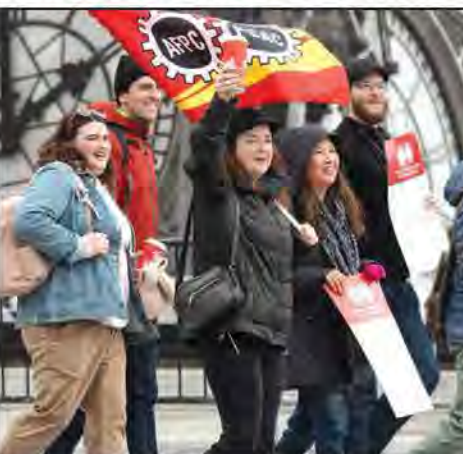
ਗਿਆ ਹੈ ਅਤੇ ਇਸ ਹੜਤਾਲ ਕਾਰਨ 155000 ਤੋਂ ਵੀ ਜ਼ਿਆਦਾ ਸਰਕਾਰੀ ਮੁਲਾਜ਼ਮ ਪ੍ਰਭਾਵਤ ਹੋਏ ਹਨ ਜਿਨ੍ਹਾਂ ਵਿਚ ਇਮੀਗ੍ਰੇਸ਼ਨ ਰਿਵਿਊਜੀ ਔਡ ਸਿਟੀਜ਼ਨਸ਼ਿਪ ਕੈਨੇਡਾ (ਆਈਆਰਸੀਸੀ) ਨਾਲ ਸਬੰਧਤ ਮੁਲਾਜ਼ਮ ਵੀ ਸ਼ਾਮਿਲ ਹਨ। ਹੜਤਾਲ 19 ਅਪ੍ਰੈਲ ਨੂੰ ਸ਼ੁਰੂ ਹੋਈ ਸੀ। ਪੀਐਸਏਸੀ ਨੇ

ਆਪਣੇ ਮੈਂਬਰਾਂ ਨੂੰ ਕੰਮ 'ਤੇ ਵਾਪਸ ਆਉਣ ਦੀ ਹਦਾਇਤ ਕੀਤੀ ਹੈ। ਵੈਡਰਲ ਮੁਲਾਜ਼ਮਾਂ ਜਿਹੜੇ ਹੜਤਾਲ 'ਤੇ ਸਨ ਦੀ ਪ੍ਰਤੀਨਿਧਤਾ ਕਰਦੀ ਪੀਐਸਏਸੀ ਨੇ ਕਿਹਾ ਕਿ ਆਰਜ਼ੀ ਸਮਝੌਤੇ ਵਿਚ ਉੱਚੀ ਤਨਖਾਹ ਜਿਹੜੀ ਮਹਿੰਗਾਈ ਦਾ ਪਾੜਾ ਪੂਰਾ ਕਰੇਗੀ ਪਰ ਤੋਂ ਕੰਮ ਕਰਨ ਲਈ ਨਵੀਂ ਤੇ ਸੁਪਰੀ ਡਾਸ਼ਾ ਸਮੇਤ ਇਸ ਦੇ ਮੈਂਬਰਾਂ ਲਈ ਹੋਰ ਅਨੁਕੂਲ ਵਿਵਸਥਾਵਾਂ ਸ਼ਾਮਿਲ ਹਨ। ਆਈਆਰਸੀਸੀ ਨੇ ਆਪਣੀ ਵੈੱਬਸਾਈਟ 'ਤੇ ਕਿਹਾ ਕਿ ਅਗਲੇ ਕੁਝ ਦਿਨ ਅਤੇ ਹਫ਼ਤੇ ਕੁਝ ਸੇਵਾਵਾਂ ਪ੍ਰਭਾਵਤ ਰਹਿ ਸਕਦੀਆਂ ਹਨ ਕਿਉਂਕਿ ਸੇਵਾਵਾਂ ਨੇ ਪੂਰੀ ਸਮਰੱਥਾ ਵਿਚ ਅਜੇ ਆਉਣਾ ਹੈ। ਲੇਬਰ ਵਿਘਨ ਦੌਰਾਨ ਇਸ ਸਫੇ ਨੂੰ ਅਸੀਂ ਤੁਹਾਨੂੰ ਇਹ ਦੱਸਣ ਲਈ ਅਪਡੇਟ ਕਰਨਾ ਜਾਰੀ ਰੱਖਾਂਗੇ ਕਿ ਸੇਵਾਵਾਂ ਕਿਵੇਂ ਪ੍ਰਭਾਵਤ ਹੁੰਦੀਆਂ ਹਨ। ਹੜਤਾਲ ਦੌਰਾਨ ਆਈਆਰਸੀਸੀ ਨੇ ਕਈ ਖੇਤਰਾਂ ਵਿਚ ਦੇਰੀ ਬਾਰੇ ਸ਼ਾਵਧਾਨ ਕੀਤਾ ਹੈ। ਹੜਤਾਲ ਦੌਰਾਨ ਕੈਨੇਡਾ ਵਿਚ ਆਪਣੇ ਠਹਿਰਨ ਦੇ ਸਮੇਂ ਨੂੰ ਵਧਾਉਣ ਲਈ ਆਈਆਰਸੀਸੀ ਕੋਲ ਆਨਲਾਈਨ ਅਪਲਾਈ ਕਰਨਾ ਅਜੇ ਵੀ ਸੰਭਵ ਹੈ। ਹੜਤਾਲ ਦੇ ਝਾੜਜੂਦ ਆਈਆਰਸੀਸੀ ਨੇ ਆਪਣੇ ਨਿਯਮਤ ਤੌਰ 'ਤੇ ਆਪਣਾ ਐਕਸਪ੍ਰੈਸ ਔਟਰੀ ਡਰਾਅ ਕੌਂਢਿਆ ਜਿਸ ਵਿਚ 3500 ਹੋਰ ਉਮੀਦਵਾਰਾਂ ਨੂੰ ਪਰਮਾਨੋਂਟ ਰੈਜ਼ੀਡੈਂਸ ਲਈ ਅਪਲਾਈ ਕਰਨ ਵਾਸਤੇ ਸੱਦਾ ਦਿੱਤਾ ਗਿਆ ਹੈ।