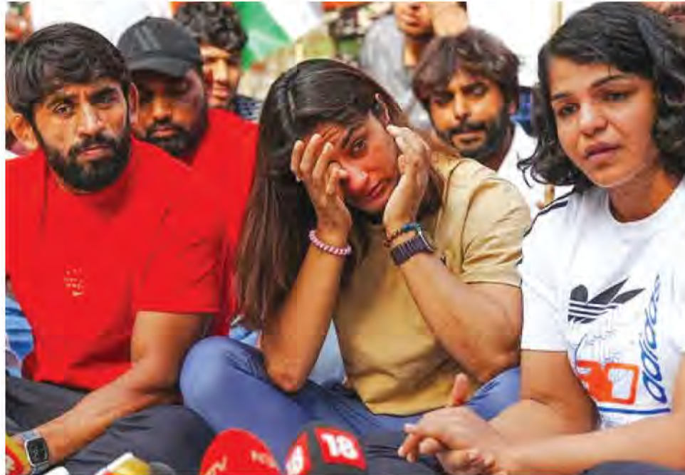
ਵਾਰੀ ਨੈਸ਼ਨਲ ਚੈਂਪੀਅਨਸ਼ਿਪ 'ਚ ਜੂਨੀਅਰ ਪਹਿਲਵਾਨਾਂ ਨੂੰ ਸਭ ਦੇ ਸਾਹਮਣੇ ਬੰਦ ਵੀ ਮਾਰ ਦਿੱਤਾ ਸੀ ਤੇ ਇਸ ਦੇ ਨਾਲ ਹੋਰ ਵੀ ਕਈ ਮਾਮਲੇ ਜਿਵੇ ਨੈਸ਼ਨਲ ਚੈਂਪੀਅਨਸ਼ਿਪ 'ਚ ਬੁਨਿਆਦੀ ਸਹੂਲਤਾਂ ਦੀ ਘਾਟ ਤੇ ਵਿਦੇਸ਼ੀ ਦੌਰਿਆਂ ਤੇ ਖਿਡਾਰੀਆਂ ਨੂੰ ਵੀਜ਼ਾ, ਟਿਕਟ ਤੇ ਹੋਰ ਜਾਣਕਾਰੀ ਸਹੀ ਨਾਂ ਦੇਣ ਤੋਂ ਇਲਾਵਾ ਕੁ.ਪੀ ਸਰਕਾਰ ਨੇ ਜੋ ਕੁਸ਼ਤੀ ਨੂੰ ਅਭਾਪਟ ਕਰਨ ਦਾ ਜੋ ਐਲਾਨ

ਅੱਗੇ ਆਇਆਂ ਤੇ ਉਨ੍ਹਾਂ ਨੇ ਦੇਸ਼ ਦੇ ਨਾਮੀ ਪਹਿਲਵਾਨਾਂ ਨਾਲ ਖੇਡ ਇਕਰਾਰਨਾਮੇ ਕਰਨੇ ਸ਼ੁਰੂ ਕਰ ਦਿੱਤੇ ਤੇ ਇਸ ਨਾਲ ਪਹਿਲਵਾਨਾਂ ਦੇ ਖੇਡ ਪ੍ਰਦਰਸ਼ਨ ਦੇ ਵਿਚ ਸੁਧਾਰ ਹੋਣਾ ਸ਼ੁਰੂ ਹੋ ਗਿਆ ਤੇ ਇਸ ਨਾਲ ਵੱਧ ਪਹਿਲਵਾਨ ਖੇਡ ਮੈਂਡਰਾਲੇ ਦੀਆਂ ਟਾਪ ਸਕੀਮਾਂ ਦੇ ਸ਼ਾਮਿਲ ਹੋਣ ਲੱਗੇ ਤੇ ਪਹਿਲਵਾਨਾਂ ਨਾਲ ਸਿੰਧਾ ਰਾਖਤਾ ਗੈਰ ਸਰਕਾਰੀ ਸੰਗਠਨਾਂ ਦਾ ਵੈਡਰੇਸ਼ਨ ਦੇ ਆਧਿਕਾਰੀਆਂ ਨੂੰ ਰਾਸ ਨਹੀ ਆਇਆ ਤੇ ਭਾਰਤੀ ਕੁਸ਼ਤੀ ਵੈਡਰੇਸ਼ਨ ਨੇ 2022 'ਚ ਇਸ ਤਰਾਂ ਦੀ ਮਦਦ ਤੇ ਰੋਕ ਲਗਾ ਦਿੱਤੀ ਤੇ ਨਾਲ ਹੀ ਇਹ ਵੈਡਰੇਸ਼ਨ ਦੀ ਮਨਜ਼ੂਰੀ ਤੋਂ ਬਿਨਾਂ ਕੋਈ ਵੀ ਪਹਿਲਵਾਨ ਇਕਰਾਰ ਨਹੀ ਕਰ ਸਕਦਾ ਤੇ ਇਸ ਨਾਲ ਪਹਿਲਵਾਨਾਂ ਨੂੰ ਵਿਦੇਸ਼ੀ ਟਰੇਨਿੰਗ, ਮਨ ਪਸੰਦ ਕੋਚ ਤੇ ਫੀਜ਼ਿਓ ਤੇ ਹੋਰ ਸਹੂਲਤਾਂ ਮਿਲਣੀਆਂ ਬੰਦ ਹੋ ਗਈਆਂ ਤੇ ਟੋਕੀਓ ਉਲੰਪਿਕ ਤੋਂ ਬਾਦ ਪਹਿਲਵਾਨਾਂ ਦੇ ਵਿਦੇਸ਼ੀ ਦੌਰੇ ਬੰਦ ਹੋ ਗਏ ਤੇ ਵਿਦੇਸ਼ੀ ਕੋਚ ਵੀ ਹਟਾ ਦਿੱਤੇ ਗਏ ਤੇ ਇਸ ਨਾਲ ਹੀ 2018 'ਚ ਭਾਰਤੀ ਕੁਸ਼ਤੀ ਵੈਡਰੇਸ਼ਨ ਨੇ ਬੀ.ਸੀ.ਸੀ.ਆਈ ਦੀ ਤਰਜ਼ ਤੇ ਜੋ 150 ਪਹਿਲਵਾਨਾਂ ਦੀ ਗਰੇਡਿੰਗ ਕੀਤੀ ਸੀ, ਉਸ ਨੂੰ ਵੀ ਸਹੀ ਢੰਗ ਨਾਲ ਲਾਗੂ ਨਹੀ ਕੀਤਾ ਤੇ ਦੋ ਤਿੰਨ ਕਿਸ਼ਤਾਂ ਦੇ ਕੇ ਬੰਦ ਕਰ ਦਿੱਤਾ ਤੇ ਕੁਸ਼ਤੀ ਵੈਡਰੇਸ਼ਨ ਨੇ ਟਾਟਾ ਮੈਂਟਰਜ਼ ਨੂੰ ਕੁਸ਼ਤੀ ਦਾ ਨੈਸ਼ਨਲ ਸਪਾਂਸਰ ਬਣਾ ਦਿੱਤਾ ਤੇ ਹੁਣ ਖਿਡਾਰੀਆਂ ਨੂੰ ਪ੍ਰਾਈਵੇਟ ਸਪਾਂਸਰ ਮਿਲਣੇ ਬੰਦ ਹੋ ਗਏ ਤੇ ਕੁਸ਼ਤੀ ਵੈਡਰੇਸ਼ਨ ਪਹਿਲਵਾਨਾਂ ਨੂੰ ਪੈਸੇ ਦੇ ਨਹੀ ਰਿਹਾ ਸੀ ਤੇ ਇਸ ਮਾਮਲੇ ਤੇ ਅੰਦਰਖਾਤੇ ਪਹਿਲਵਾਨਾਂ ਤੇ ਕੁਸ਼ਤੀ ਵੈਡਰੇਸ਼ਨ ਦਾ ਦਰਮਿਆਨ ਹੌਲੀ ਹੌਲੀ ਰੇਜਿਸ਼ਟਰੇਸ਼ਨ ਵਧਦੀ ਗਈ। ਭਾਰਤੀ ਕੁਸ਼ਤੀ ਵੈਡਰੇਸ਼ਨ ਦੇ ਪ੍ਰਧਾਨ ਬਿਜੂ ਭੂਸ਼ਣ ਸ਼ਰਣ ਸਿੰਘ ਤੇ ਇਕ ਬਾਹੁਬਲੀ ਨੇਤਾ ਹੋਣ ਕਰਕੇ ਤਾਨਾਸ਼ਾਹੀ ਦੇ ਦੋਸ਼ ਲਗਦੇ ਹਨ ਤੇ ਉਹ ਸਾਰਾ ਕੁੱਝ ਕੁਸ਼ਤੀ ਵੈਡਰੇਸ਼ਨ 'ਚ ਆਪਣੇ ਤਰੀਕੇ ਅਨੁਸਾਰ ਤਹਿ ਕਰਦੇ ਹਨ ਤੇ ਇਕ