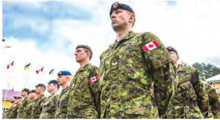
ਭੁੱਖੀ ਹਮਦਰਦੀ ਹੈ। ਗਲੋਬਲ ਅਫੇਅਰਜ਼ ਨੇ ਇਕ ਈਮੇਲ ਉਨ੍ਹਾਂ ਬਰਦਰ ਨਾਇਕ ਆਖਿਆ ਹੈ।