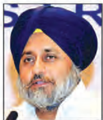
(ਬਾਕੀ ਸਫ਼ਾ 6 'ਤੇ)