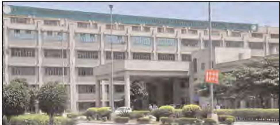
ਸਾਢੇ ਛੇ ਕਰੋੜ ਰੁਪਏ ਦੇਣੇ ਸਨ, ਪਰ ਇਹ ਰਕਮ ਸਿਰਫ ਇੱਕੋ ਵਾਰ ਦਿੱਤੀ ਗਈ, ਜਦੋਂ ਮੁੱਖ ਮੰਤਰੀ ਨੇ 2 ਜੂਨ ਨੂੰ ਪਿਮਸ ਸੁਸਾਇਟੀ

ਦੀ ਮੀਟਿੰਗ ਸੱਦੀ ਸੀ। ਇਸ ਕਾਲਜ ਵੱਲ ਅਜੇ ਵੀ 65 ਕਰੋੜ ਰੁਪਏ ਦੀ ਦੇਣਦਾਰੀ ਬਾਕੀ ਹੈ। ਵਿਭਾਗ ਦੇ ਅਫਸਰਾਂ ਦਾ ਕਹਿਣਾ